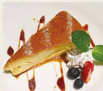
焼きパンナコッタ