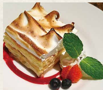
ズッパイングレーゼ