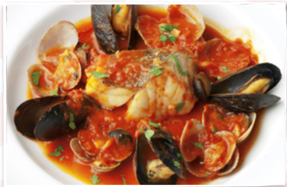
スズキのトマトパッツァ ¥1,280 ※8月末まで期間限定実施予定。