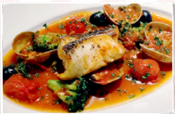
季節の魚介トマトパッツァ ¥1,280