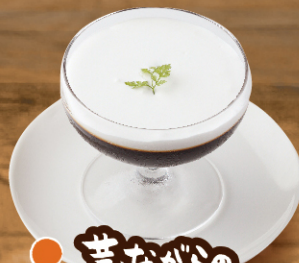
昔ながらの コーヒーゼリー