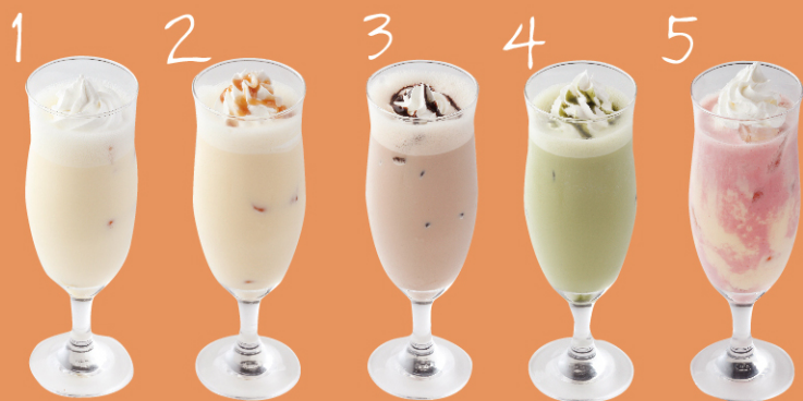
パイズ キャラメル チョコ 抹茶 アイス