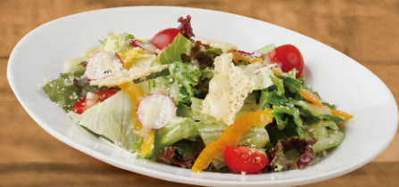
彩り野菜のサラダ