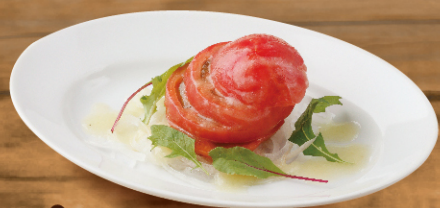
まるごとトマトのサラダ