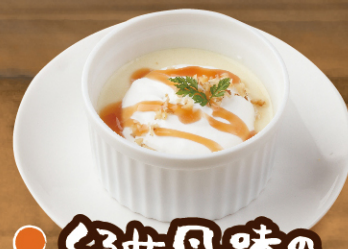
くるみ風味の プリン