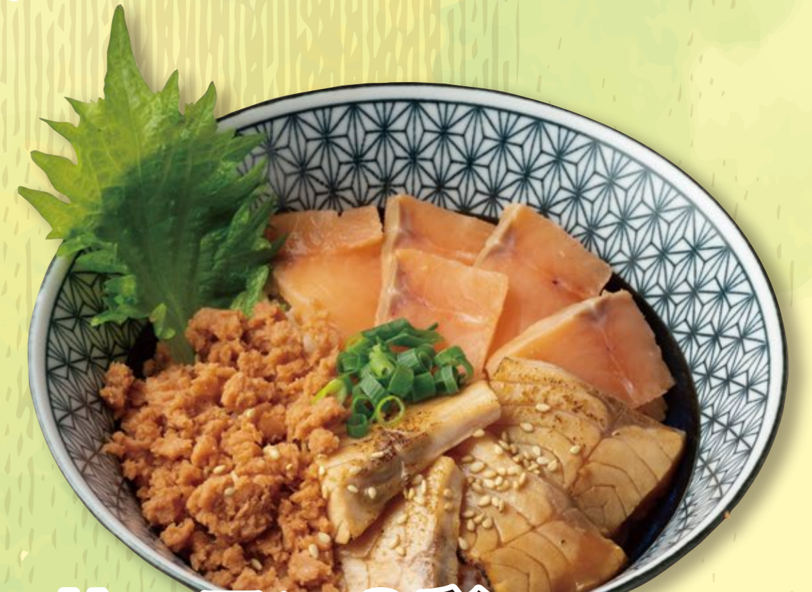
サーモン3彩 (ばんさい) 1,290円