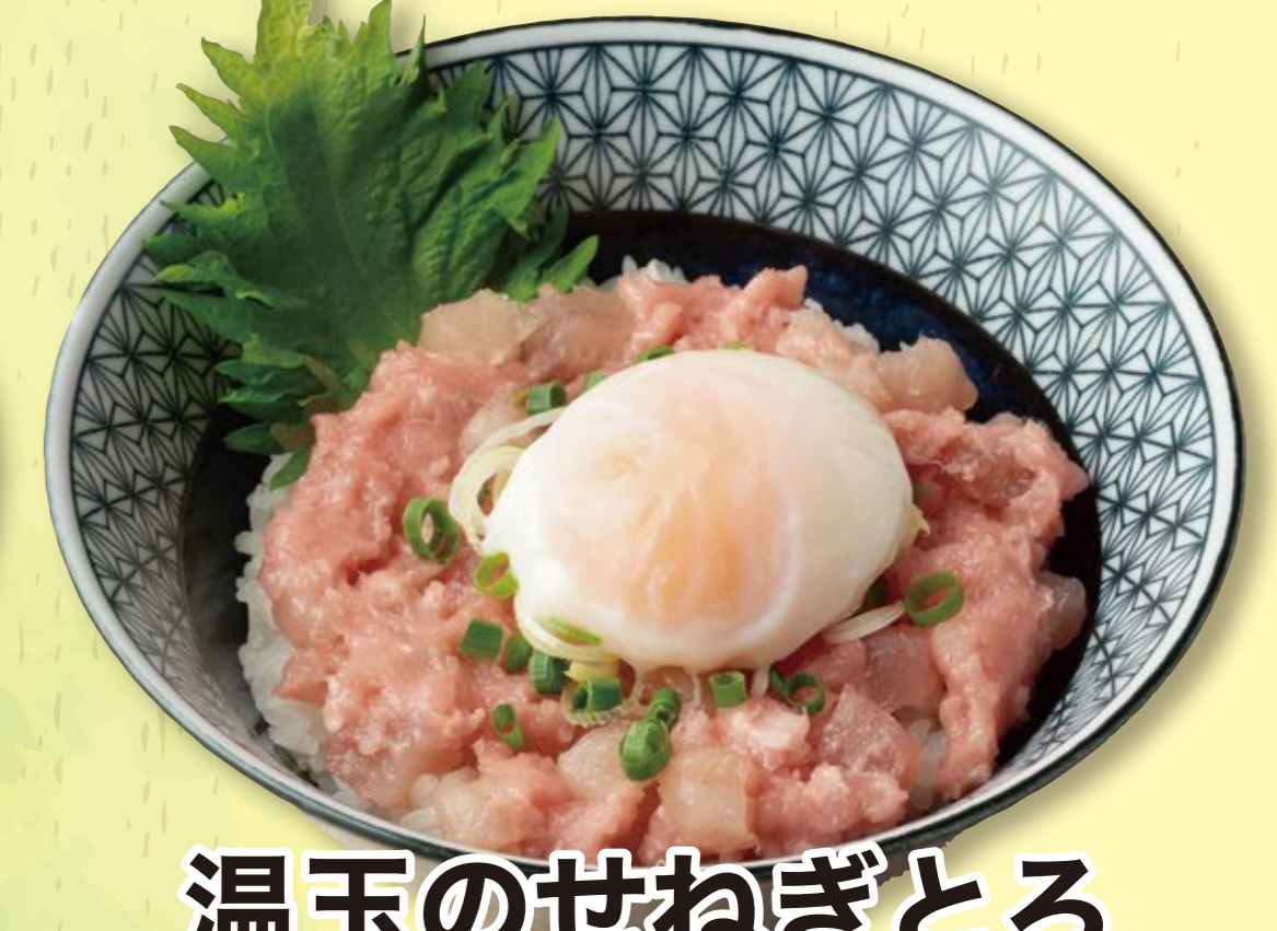
温玉のせねぎとろ 1,150円