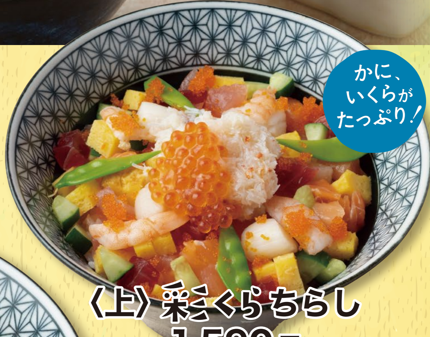
かに、いくらがたっぷり! 〈上〉彩くらちらし 1,590円