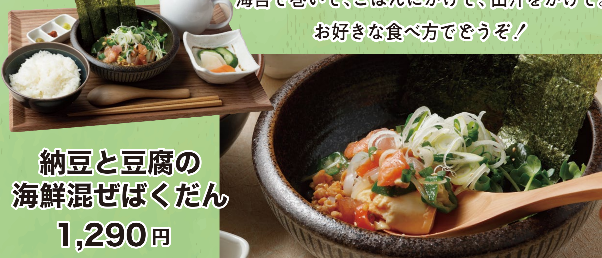
納豆と豆腐の 海鮮混ぜばくだん 1,290円

豆腐と海鮮を混ぜるヘルシーな海鮮丼。 海苔で巻いて、ごはんにかけて、出汁をかけて。 好きな食べ方でどうぞ!