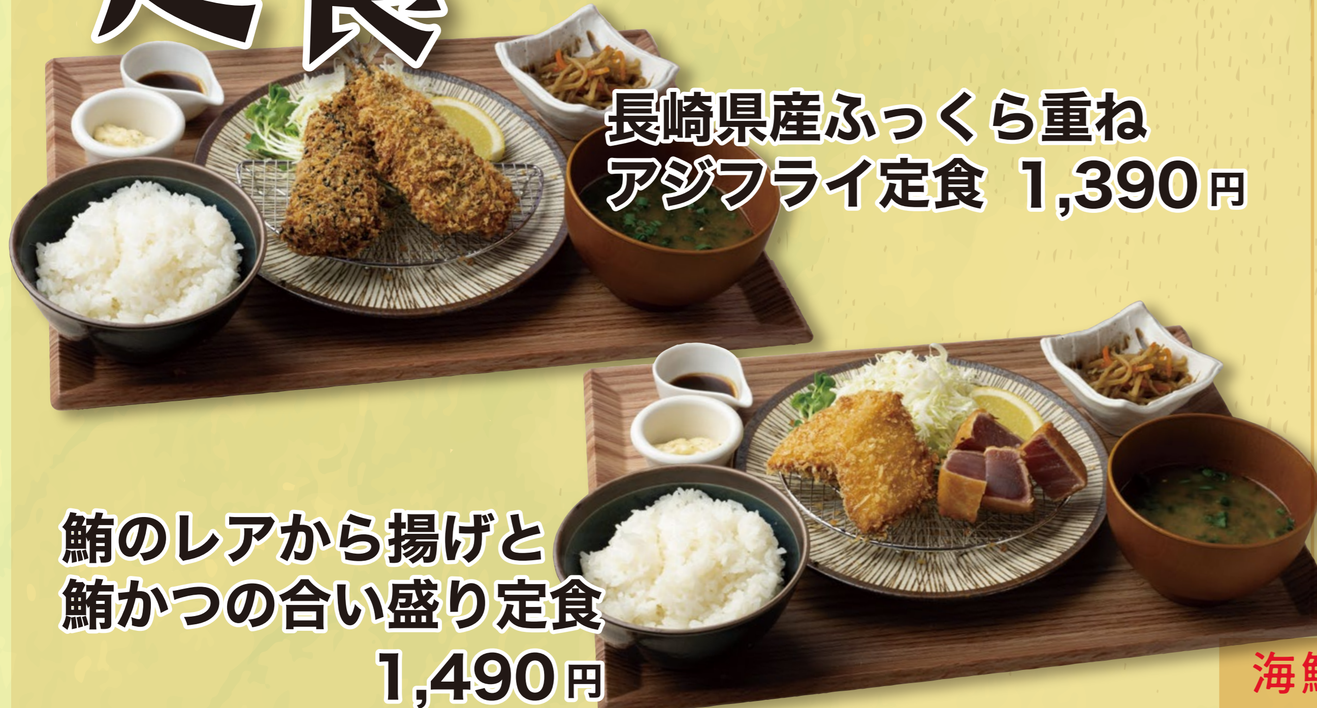
鯖のレアから揚げと 鯖かつの合い盛り定食 1,490円