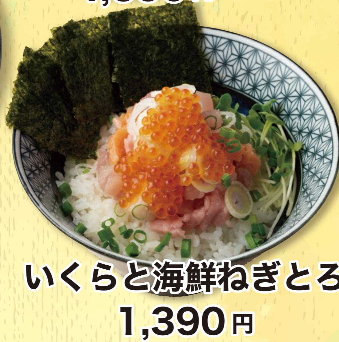
いくらと海鮮ねぎとろ 1,390円